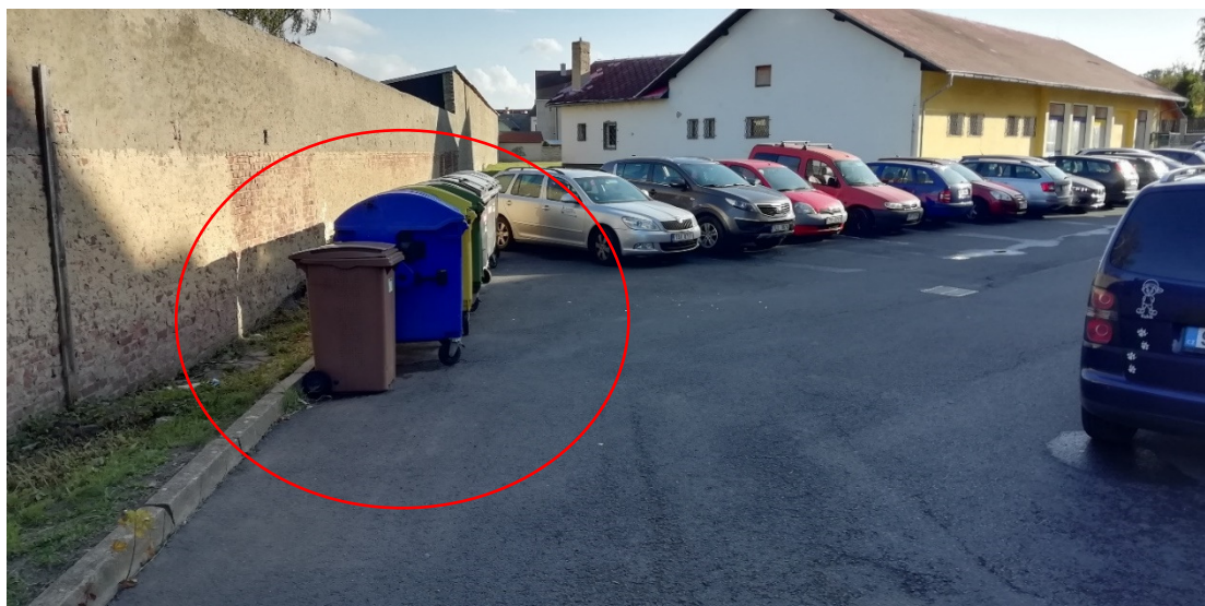
Obrázek 1 a 2 – pohled na popelnice Dolejšova čp 731