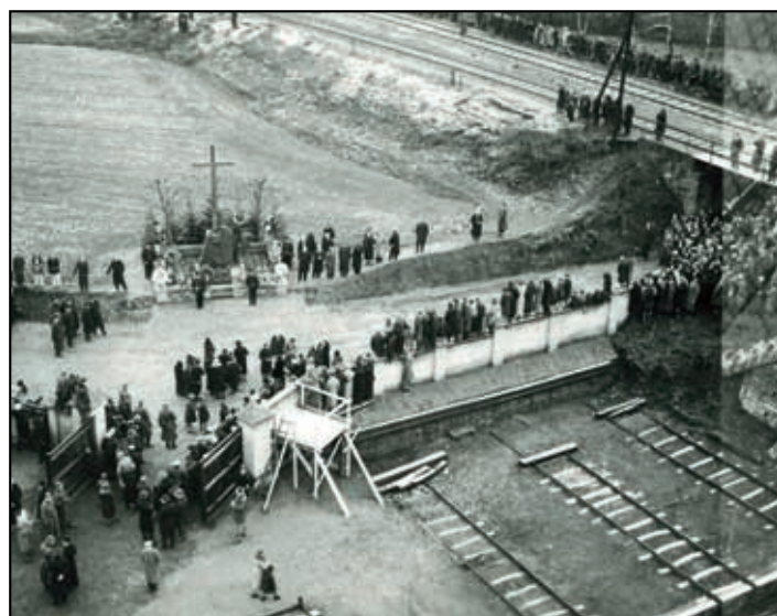
Odhavení 1. památníku obětem nelsonské katastrofy - dolní Osek 1934