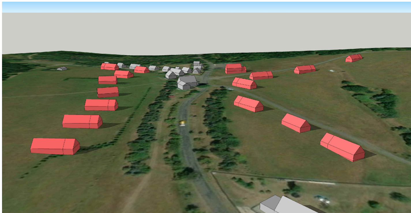
POHLED NA PROSTOR "ROZCESTÍ" NA SEVERU