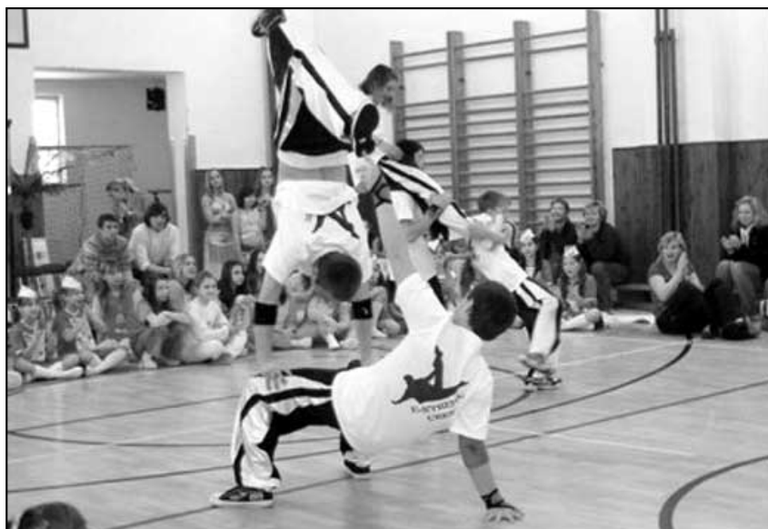
Dance CUP 2009 - E-xtreme Crew, Varnsdorf

Sobotní dopoledne 10. ledna patřilo (Pokračování na následující straně)